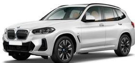
BMW iX3 (2) 5 Türen, 5 Plätze