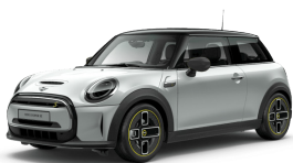
Mini Cooper SE 3 Türen, 4 Plätze