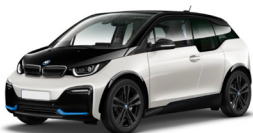
BMW i3s (3) 5 Türen, 4 Plätze