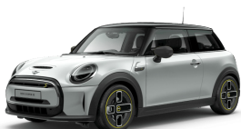
Mini Cooper SE 3 Türen, 4 Plätze

Reichweite 284 km Preiskategorie: II - electro