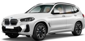
BMW iX3 (1) 5 Türen, 5 Plätze

Reichweite 590 km Preiskategorie: I - adventure